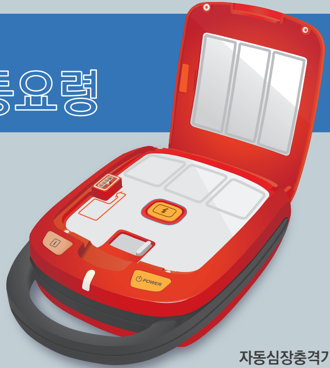
자동심장충격기 (자동제세동기, AED)

환자의 피부에 부착된 전극을 통하여 전기충격을 심장에 보내 심방이나 심실의 세동 (비정상적으로 빠르게 떨려 제대로 된 심장기능을 하지 못하는 상태) 을 제거하는 제세동기를 자동화하여 만든 의료기기